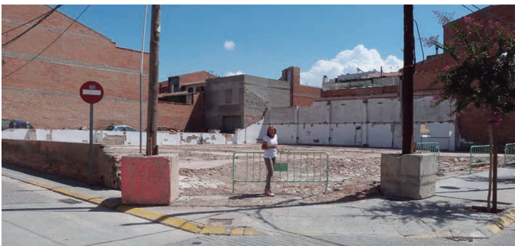
■ La regidora visitant el solar de l'antic Mercat Central que es destinarà a aparcament gratuït

En aquest sentit, Palau ha posat l'exemple de com s'ha anat millorant la preparació dels agents de la Policia Local, que ha permès disminuir el nombre de fets delictius comesos al municipi i intensificar les relacions amb les altres forces i cossos de seguretat. ■