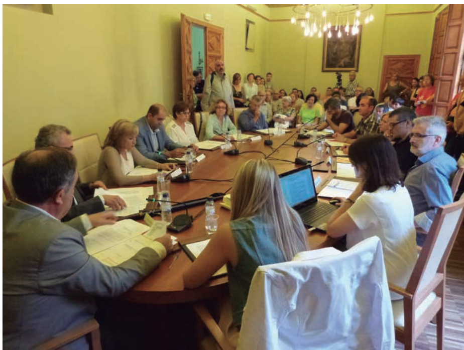
■ El Saló de Plens el dia de la investidura