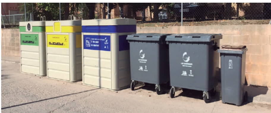
■ Una illa amb els nous contenidors al carrer Joan Maragall de les Borges