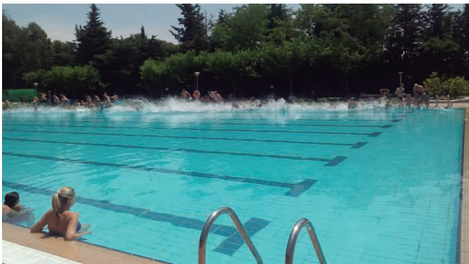
■ Salt col·lectiu de la jornada Mulla't per l'esclerosi múltiple a les Borges 2015

En definitiva, aquests pròxims anys la regidoria vol ser una eina dedicada a continuar cohesionant la societat de les Borges. ■