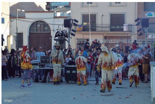
■ La Comissió va organitzar la Festa del Pas d'Equador