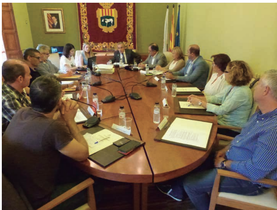
■ Els integrants del nou consistori 2015-2019