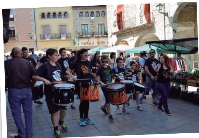
El XXXI Mercat de la Ganga de les Borges