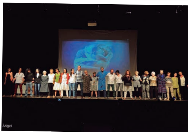
L'obra de teatre "Escenes amb tracte", al Pavelló de l'Oli