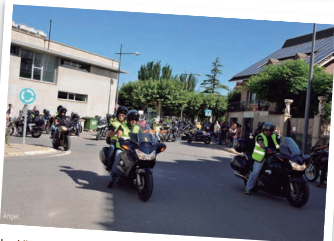
La XI Trobada Motards de les Borges, organitzada per Fot-li Gas-Tooo