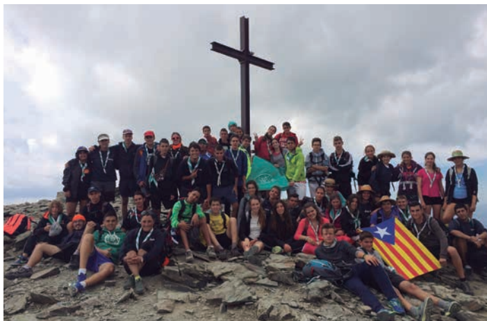
■ Els participants als campaments 2015 de l'Esplai Apassomi al cim del Puigmal