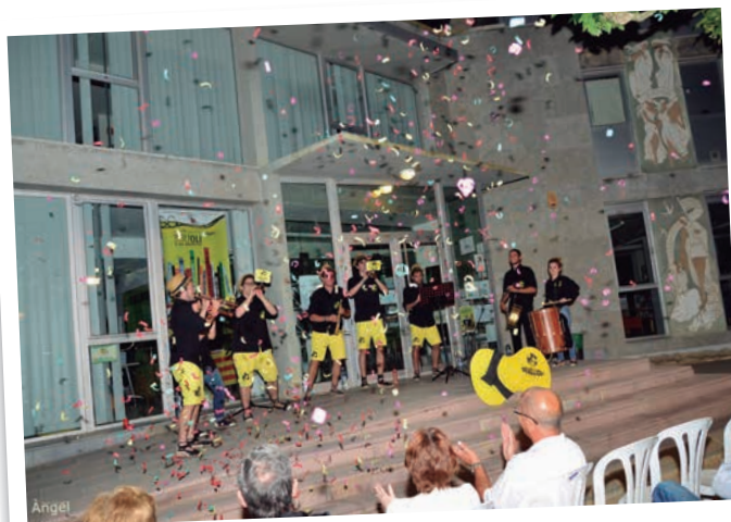
Concert amb el grup de grallers Gralliolí als jardins del Terrall