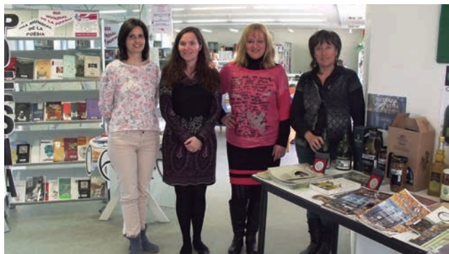
■ Les treballadores de la Biblioteca Marquès d'Olivart

Ara, la Biblioteca Marquès d'Olivart de les Borges s'encarrega de prestar prop de 26.000 documents anualment, a més d'organitzar unes 150 activitats a l'any, en les que participen unes 2.500 persones. Pels seus 600 m2 d'espai, separats en una zona infantil, una de préstec, una de consulta, més el vestíbul i el magatzem, hi passen unes 42.000 visites anuals, de les que un 70% són adults i un 30% infants. En el seu fons hi ha dipositats 41.000 documents, amb 31.700 llibres, 4.000 CD, 4.500 DVD i altres com mapes, partitures i 6 diaris i 60 revistes diferents. ■