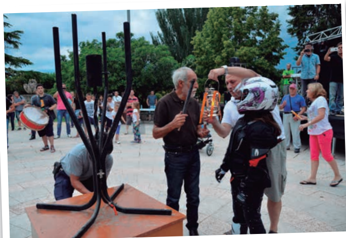
L'arribada de la Flama del Canigó 2015 a les Borges