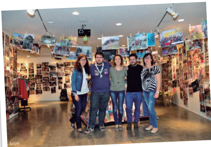
L'exposició "25 Anys del Grup d'Esplai Apassomi" a la Sala Arts 25400 de l'Espai Macià