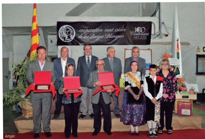
Celebració de la Festa Patronal de Sant Isidre a la Cooperativa