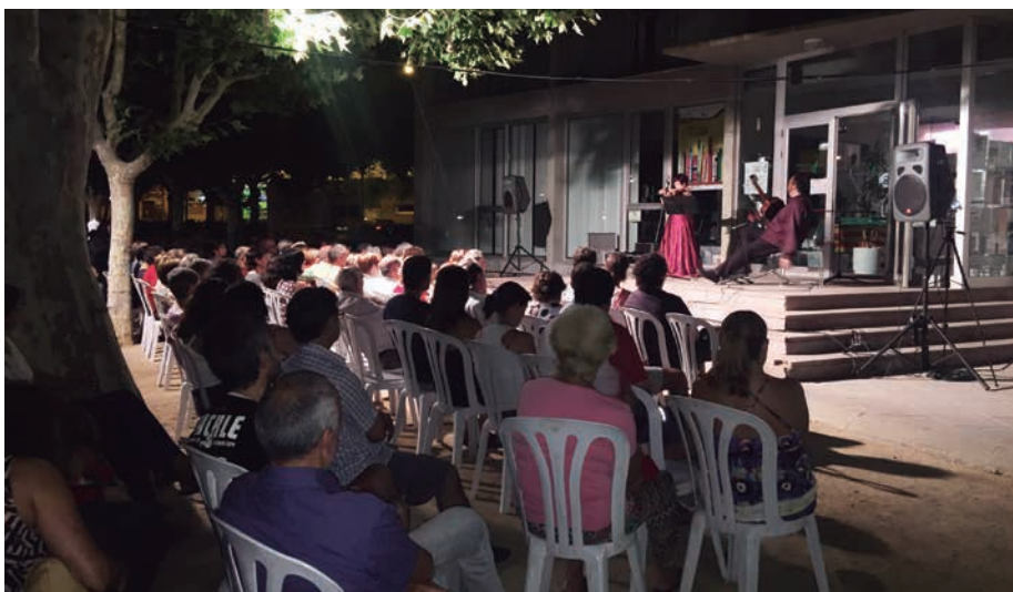
■ El concert del IV Les Garrigues Guitar Festival als Jardins del Terrall

Finalment, els responsables culturals municipals volen col·laborar i coordinar amb les entitats culturals per poder dur a terme activitats on tothom pugui participar, a banda de mantenir l'aposta pel pubillatge del nostre municipi i donar-lo a conèixer a tota la població.