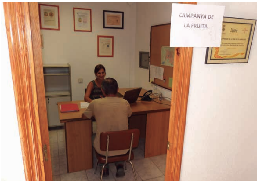
■ L'oficina de la campanya de la fruita 2015 a l'Ajuntament de les Borges

Pel que fa a les vies públiques i els camins, la regidoria vol arranjar el màxim de vies i camins que ens permeti el pressupost, sense causar molèsties als pagesos en les temporades de màxima confluència als mateixos per les diferents collites. A més, es prioritzaran les actuacions en les vies i els camins que estiguin en més mal estat de conservació.