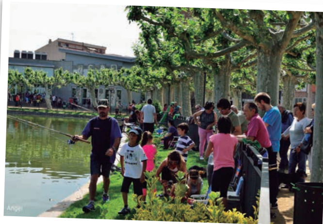
La XII Marató de Pesca al Parc del Terrall