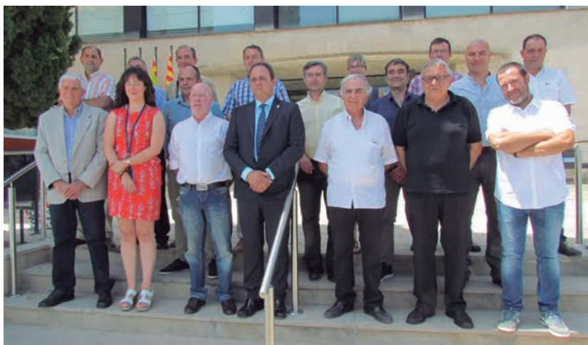
■ Els nous consellers comarcals de les Garrigues