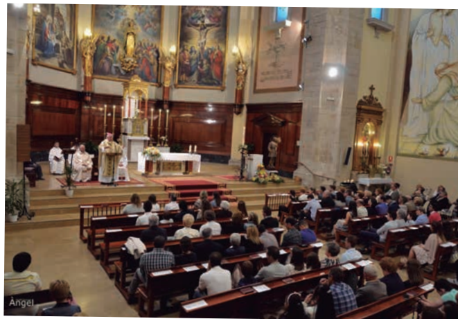
Acte de confirmació dels catequistes a càrrec del Bisbe de Lleida