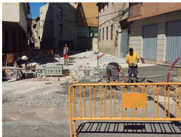
■ Les obres de millora a l'entorn de l'Espai Macià