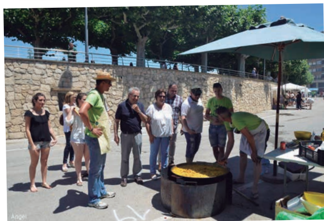
El 22è Concurs de Paelles al Terrall