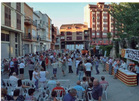
■ XXIII Aplec de Sardana 2015

A més, aquest any han organitzat la ballada de sardanes de la darrera Fira de l'Oli, i pel 21 de novembre ja preparen la Nit de la Sardana a les Borges Blanques, conjuntament amb la Federació Sardanista de les comarques lleidatanes, entre d'altres, on s'entregaran els premis del campionat de la demarcació de colles sardanistes i s'hi esperen prop de 400 persones. Finalment, també tenen la intenció d'organitzar un curs de sardanes de cara a aquesta tardor, al que desitgen que s'hi apunti força gent. ■