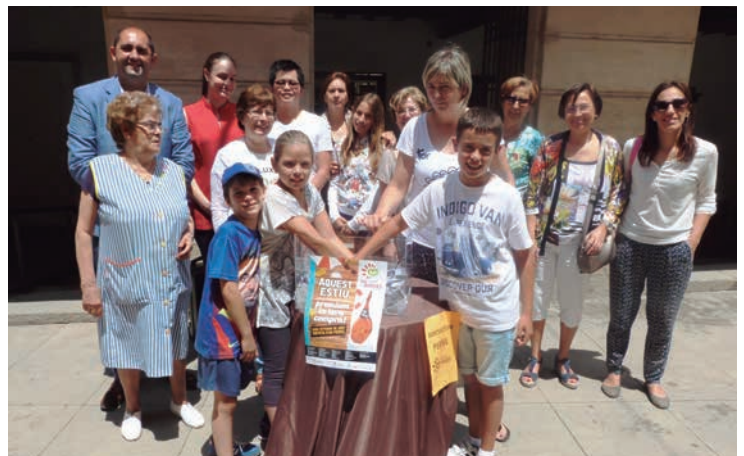
■ Sorteig d'un pèril de l'Agrupació de Comerciants de les Borges

Finalment, el regidor afirma que es necessita crear nous llocs de treball, a través de l'arribada de noves empreses a les Borges Blanques, pel que una de les principals prioritats és reactivar el Polígon de Vaca Roja i promoure la creació de sòl industrial. ■