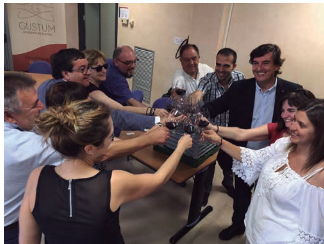
■ Els responsables polítics i educatius brindant amb vi de les Garrigues, pel nou cicle formatiu superior a l'INS Josep Vallverdú

Pel que fa a la regidoria d'Ensenyament, es continuarà apostant per una educació de qualitat i es continuarà donant ple suport als centres educatius. Consolidarem les actuacions del Pla Educatiu d'Entorn per tal que la xarxa creada al voltant dels centres escolars actuï com a veritables agents educatius que són. Establirem, definitivament, el programa de